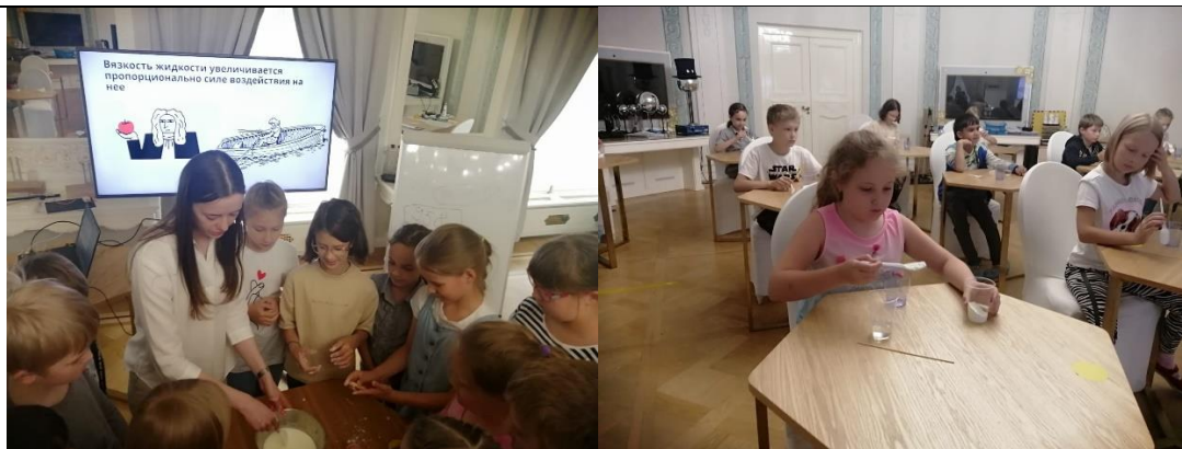
Профильная программа «Гулять по воде...»