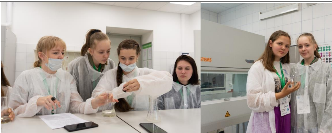
Летняя школа «Твой город цифровой» от СПбПУ

01.05-15.05.2021 Ежегодный Санкт-Петербургский турнир по Киберспорту (Боевая арена.DOTA 2). Регистрация https://forms.yandex.ru/u/604a2f2cd46a9fc7e295a60d/