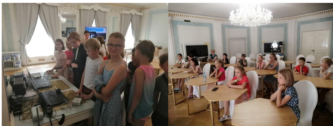
Профильная программа «Параметры человека»

07.06-11.06.2021 Летняя химико-биологическая школа ГБОУ лицея № 572, 16 участников (ГБОУ №№ 344,572,690,329).