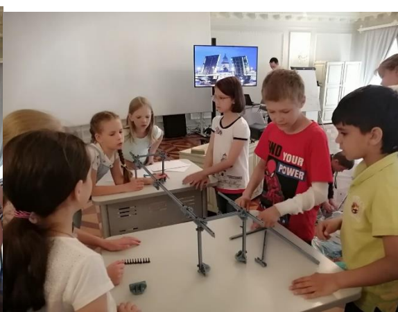
Профильная программа «Искусство наводить мосты...»