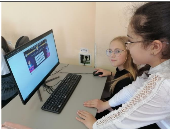
Онлайн тест «Какой ты ученый?»

20.05.2021 Онлайн тест «Какой ты ученый?». Проект создан в рамках нацпроекта «Наука и университеты» при поддержке Министерства науки и высшего образования РФ, 6,7,8 классы, 50 участников.